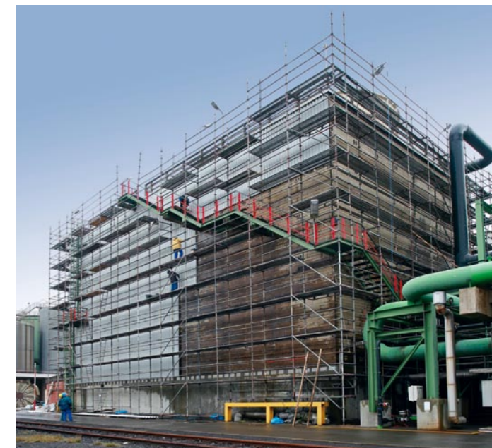
Fassadenerneuerung bei gleichzeitiger Minderung der Schallemissionen aus einer Hand