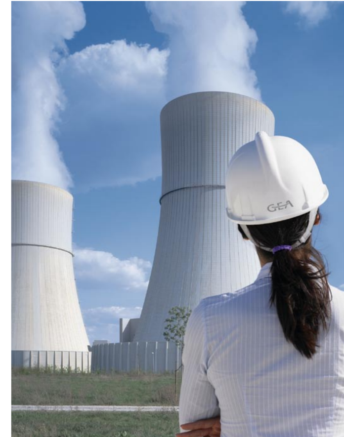
Modernste GEA Kühltechnologie bei Großkraftwerken