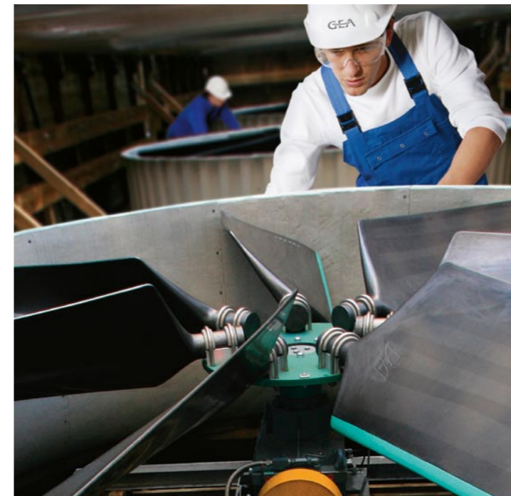
Sichtprüfungen sind ein wichtiger Bestandteil der GEA Inspektion. Sie ermöglichen eine frühzeitige Fehlererkennung und -behebung.

Als eines der wenigen weltweit tätigen Unternehmen beherrschen wir beide Kühlverfahren – die Trocken- und die Nasskühlung. Insbesondere beim Wechsel von Nass- auf Trockenkühlung oder umgekehrt ist das ein zentraler Vorteil. Sämtliche Serviceleistungen sind sowohl für GEA Anlagen und Bauteile als auch für Fremdfabrikate abrufbar. Und das weltweit in mehr als 20 Ländern.