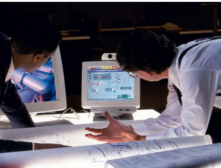
Störfall-Management online: Im direkten Gespräch mit dem Kunden werden Lösungen erarbeitet.

Unsere Erfahrungen im Anlagen-Service sind vorzugsweise in der Kraftwerkswirtschaft und in der Prozessindustrie entstanden. Die Entwicklung des Neuanlagengeschäfts zu Kühlsystemen in den Branchen Biomasse oder Müllverbrennung hat unsere Kompetenz mit den Besonderheiten verschiedener Systeme weiter gestärkt.